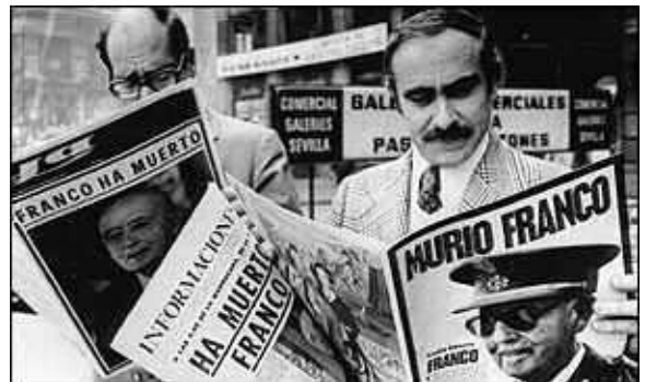
20 de Noviembre de 1975: Franco muere en la cama