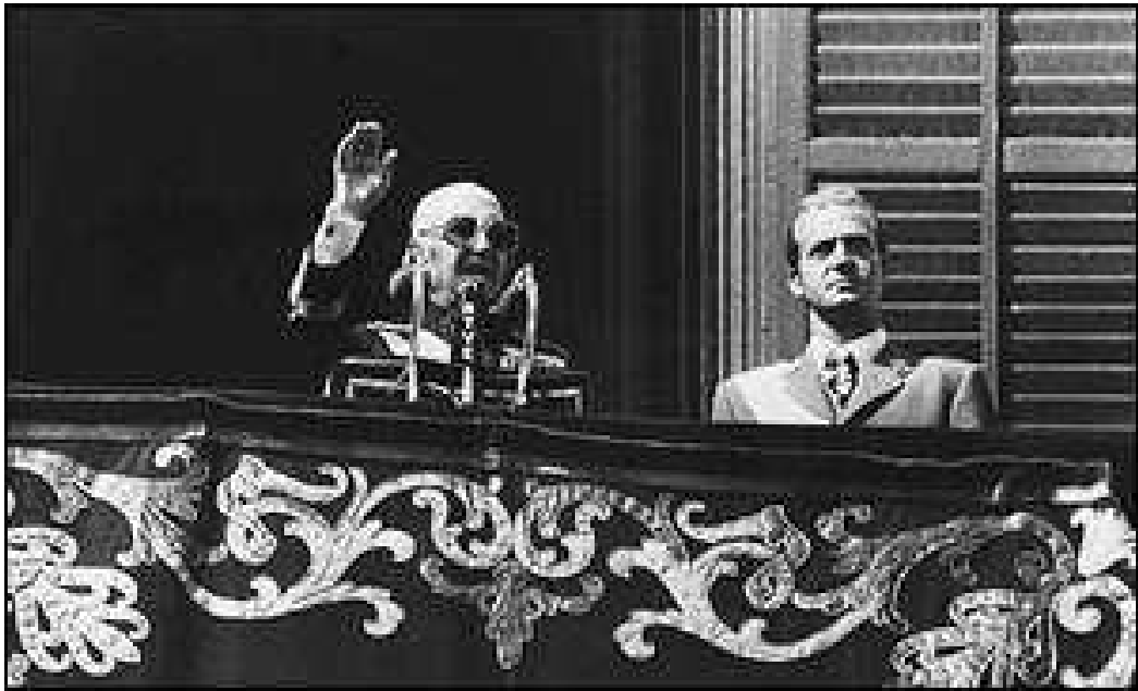
Una de las últimas apariciones públicas del dictador (1/10/1975)